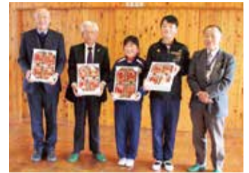
学びの森小学校へ贈呈の様子

子どもたちに食への関心、食を支える農の役割を感じてもらうため、JAは管内(大田原市・那須塩原市・那須町)の小中学校65校と特別支援学校の児童・生徒に対し、地元特産品であるイチゴ「とちおとめ」やイチゴゼリーを学校給食用に贈呈しました。生のイチゴを受け取った那須町立学びの森小学校の児童たちは「給食が楽しみ!」と満面の笑顔を見せてくれました。